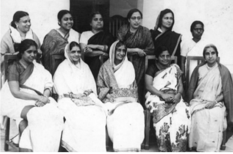
அரசியல் நிர்ணய சபையில் அங்கம் வசித்த பெண் உறுப்பினர்கள்